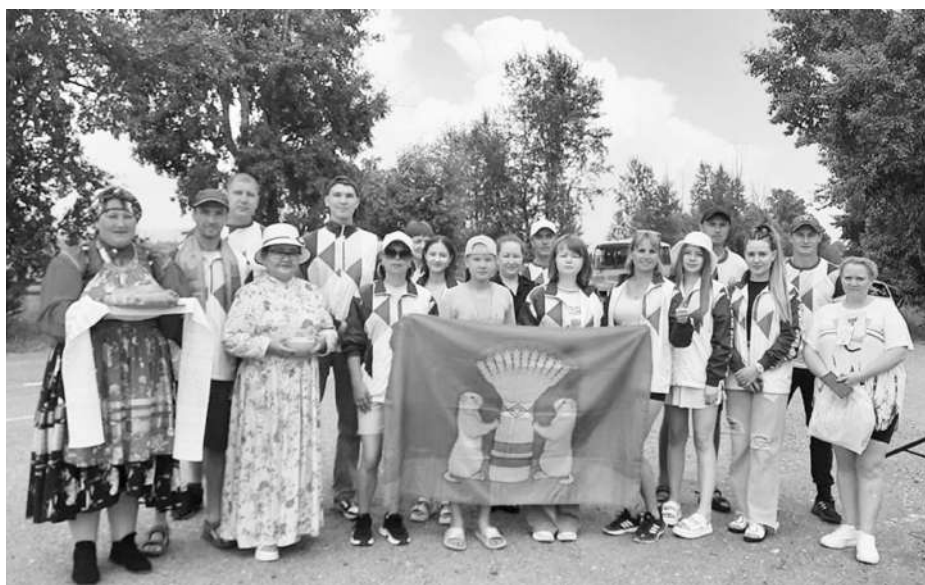
Бичурская земля встретила Тарбагатайскую команду хлебом-солью и белой пиццей

В составе нашей команды легкую атлетику представляли девять спортсменов, по спортивному ориентированию за нашу