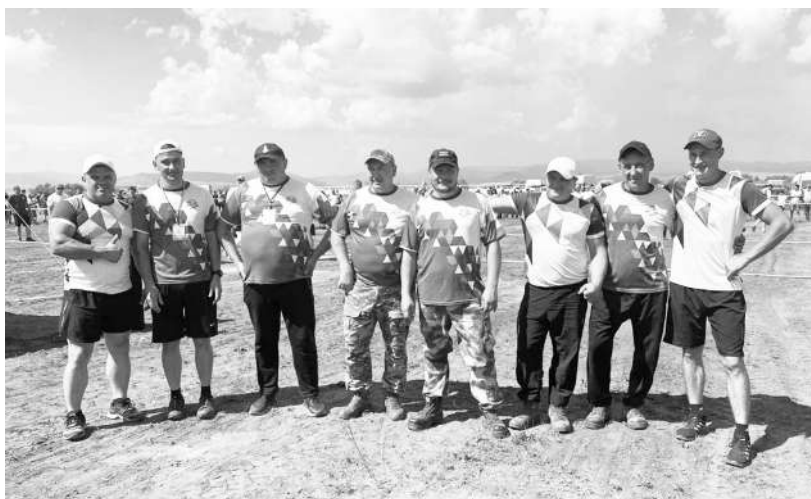
Вот они богатыри! Тарбагатайская команда по перетягиванию каната на сельских играх показала неплохие результаты