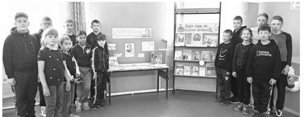
На литературной выставке в родной библиотеке

Каждый этап соревнований сопровождался бурными овациями, поддержкой товарищей и дружеским соперничеством. Ребята не только показывали свои умения, но и учились работать в команде, поддерживать друг друга и достойно принимать как победы, так и поражения.