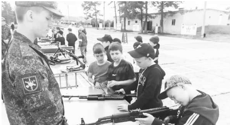
День открытых дверей в воинской части

Такое чередование активных дворовых игр и более спокойных настольных позволяет ре-