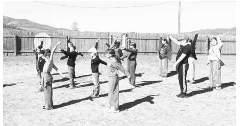
Утро в лагере в селе Пестерево начинается с зарядки