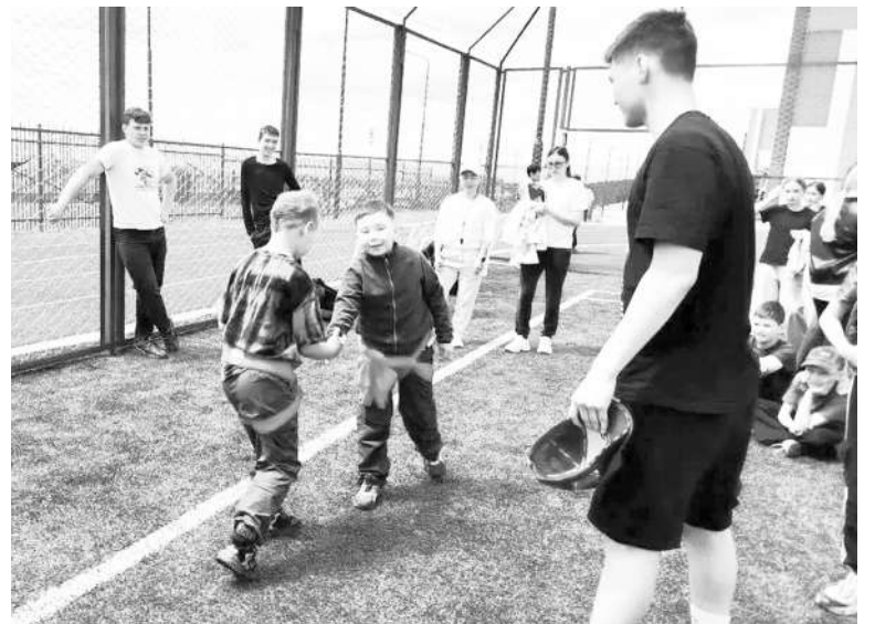
Сурхарбан в детском лагере «Алые паруса» в разгаре

Завершился праздник массовым исполнением традиционного танца ёхор. В едином кругу, взявшись за руки, все участники – дети и вожатые – закружились в ритмичном танце, символизирующем единство, дружбу и радость общения. Этот момент стал настоящим воплощением девиза смены: «В единстве – наша сила!».