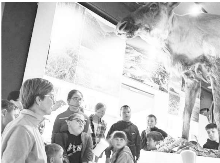
На экскурсии в Музее природы Бурятии

бятам найти занятие по душе и не уставать от однообразия. Так дни в лагере проходят весело и задорно, оставляя у ребят массу приятных впечатлений.